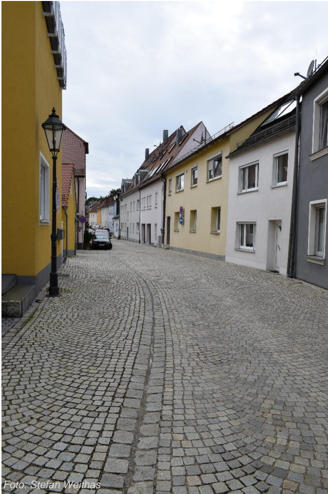
Rainbügl östlicher Bereich