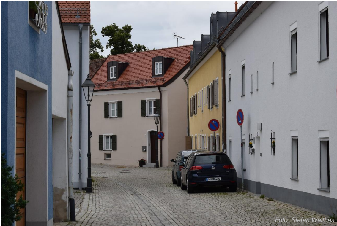
Rainbügl nördlicher Bereich