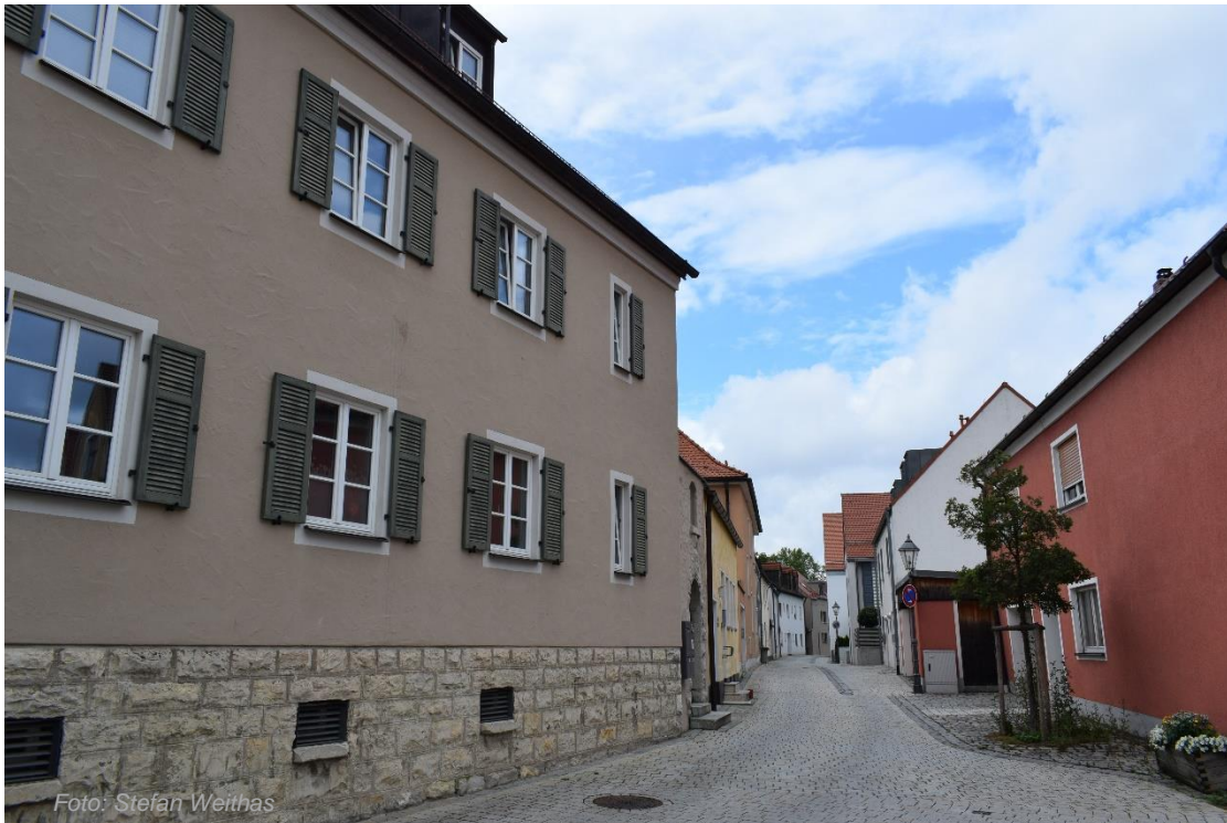
Ecke Grünbaumwirtsgasse / Rainbühl