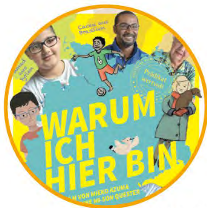
Filmplakat: Warum ich Hier bin

Anmeldung unter: www.buergerhaus-neumarkt.de