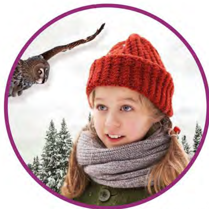
Filmplakat: Weihnachten im Zaubereulenwald