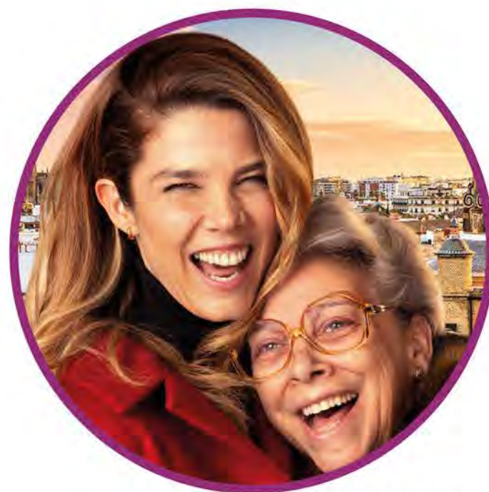
Filmplakat: Vier Wände für Zwei

Anmeldung unter: www.buergerhaus-neumarkt.de